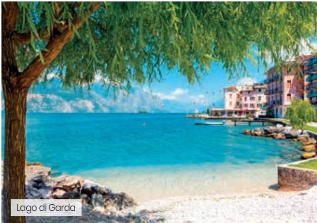
Lago di Garda

3 o 5 notti solo pernottamento + utilizzo piscina