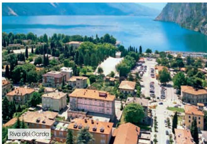
Riva del Garda

"le nostre Stelle" DA 230€ 255€ A PERSONA, 3 NOTTI