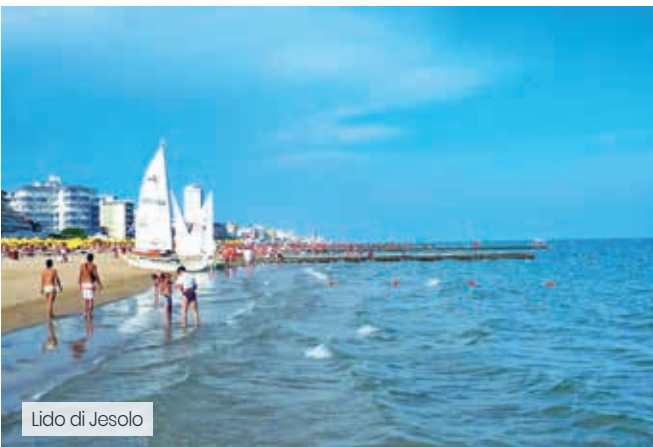
Lido di Jesolo