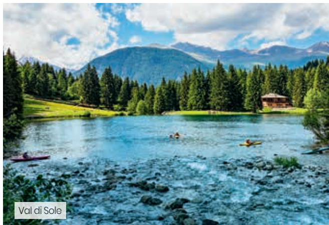
Val di Sole

2, 3 o 5 notti mezza pensione + utilizzo centro benessere + Val di Sole Opportunity - Guest Card